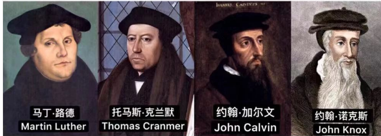
马丁·路德 Martin Luther