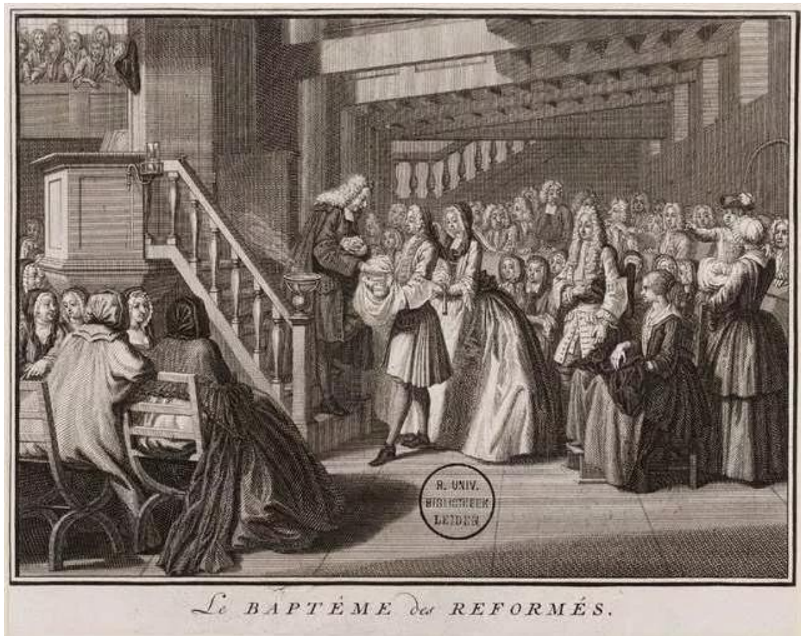
法国改革宗教会的婴儿洗礼

上帝救赎人，是以 圣约 (Covenant) 的方式、 家庭 (household) 的方式救赎人。从旧约到新约，一贯出现的是“约”、是“全家”。 婴儿洗礼 又称“ 圣约孩童洗礼 ”、“ 家庭洗礼 ”。 浸礼派对婴儿洗礼的抵挡，源自重洗派神学的个人主义思想。他们没有集体的、团契的、教会的概念，他们骨子里喜欢分离和拆散，他们的神学表达出来都是一个个抽离的、分开的、单独的“概念”，从来没有整全的、前后一致的“系统”。只有一棵棵树，没有森林。