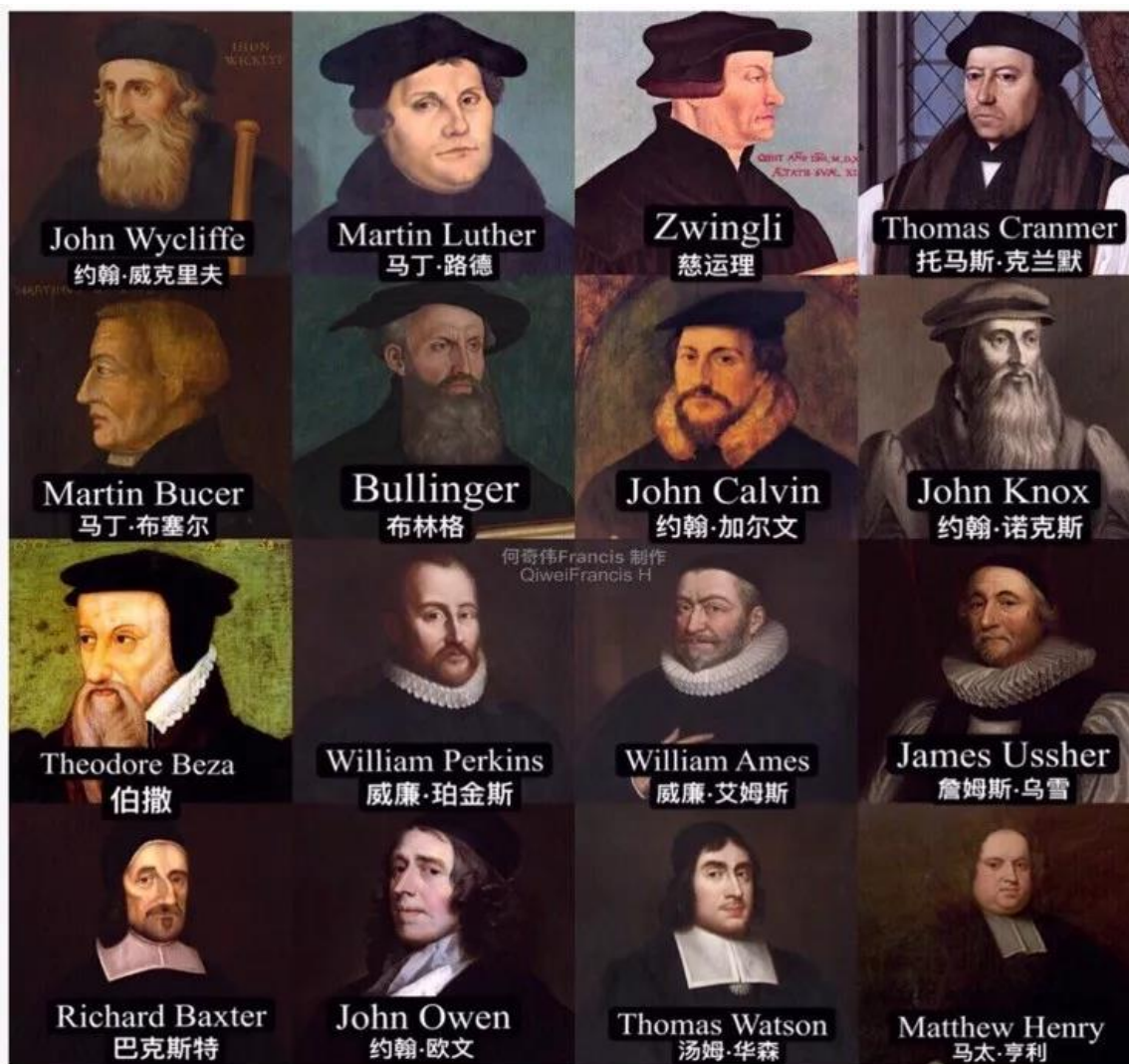
宗教改革家与杰出的清教徒，我们应当效法的圣徒

笔者祈愿，在追念诸圣的同时，我们能够稍微窥视到天国福乐的远景，激起我们对属天事物的向往；看到诸圣先贤在世生活的榜样，读到他们曾经宣讲的基督的福音，也鼓励我们步武他们的芳踪，继续宣讲那纯正的福音，勇敢走上成圣的道路。正如圣徒所言：“我们既有这许多的见证人，如同云彩围绕着我们，就当放下各样的重担，脱去容易缠累我们的罪，存心忍耐，奔那摆在我们前头的路程，仰望为我们的信仰创始成终的耶稣。他因那摆在前面的喜乐，就轻看羞辱，忍受了十字架的苦难，便坐在上帝王座的右边”（《希伯来书》12:1—2）。